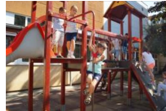
Cours de récréation