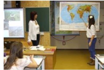
La salle de géographie